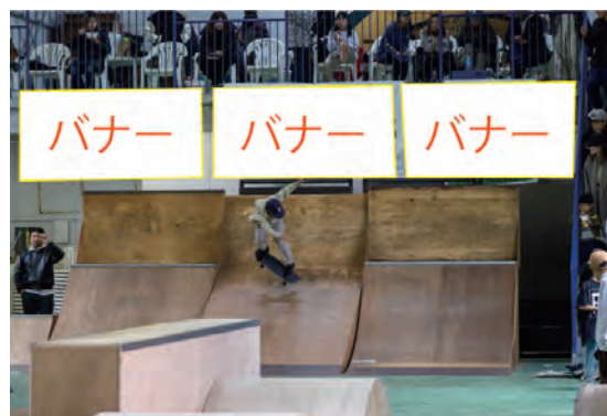
バナー(1200 x 2400)x 3 掲示イメージ